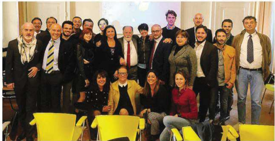
Gli iscritti all'ordine degli infermieri nella foto di gruppo all'interno della nuova sede di via Fissiraga a Lodi